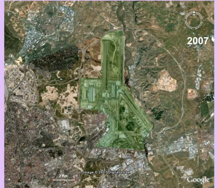
Fuente de información: AENA (1934): Atlas de aeródromos de España, Madrid, Aena, (reedición 1996)